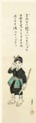
《日本男児》大正前期竹久夢二

2018年5月18日(金)・国際博物館の日 オリジナル夢二絵はがきプレゼント 先着30名様