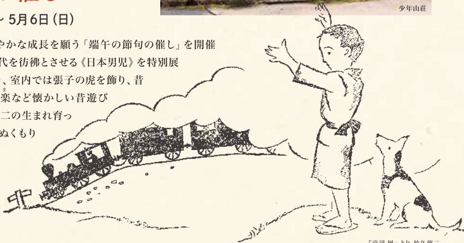
『童謡 風』より 竹久夢二

夢二生家では、こどもの健やかな成長を願う「端午の節句の催し」を開催いたします。夢二のこども時代を彷彿とさせる《日本男児》を特別展示するほか、庭には鯉のぼり、室内では張子の虎を飾り、昔ながらの室礼 しむらい でお手玉や独楽など懐かしい昔遊びをお楽しみいただけます。夢二の生まれ育った家で懐かしく日本家屋のぬくもりあるゆったりとした時間をお過ごしください。