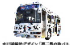
水戸岡鋭治デザイン「夢二黒の助」バス(直行バス 岡山電気軌道)