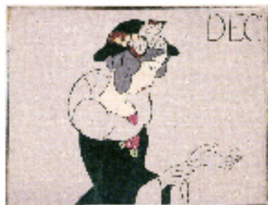
「美人グラフィックの風」

<お問い合わせ、イベントのお申込み先> TEL:086-271-1000 FAX:086-271-1730 〒703-8256 岡山市中区浜2-1-32 E-Mail:yumeji@gaea.ocn.ne.jp