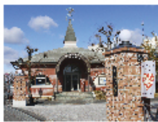
夢二郷土美術館本館