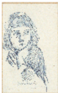
「男装スケッチ少女」