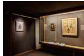
夢二生家記念館 展示室