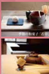
季節の和菓子「若草」

OPEN / 9:00~17:00 (カフェの営業は9:00~16:00 L.O.) 定休日 / 月曜日(夢二郷土美術館 夢二生家記念館・少年山荘の休館日と同じ) ※カフェ、ミュージアムショップのみのご利用もできます。(入館料不要)