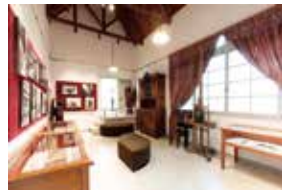
少年山荘アトリエ