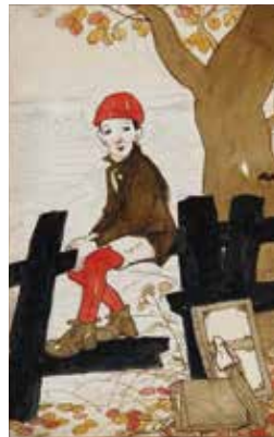
春の特別展示《少年の図》夢二郷土美術館寄託

竹久夢二のふるさと岡山の邑久(瀬戸内市)にある「夢二生家記念館・少年山荘」は、生誕135年を記念して2019年3月に、岡山市中区の本館とともに周遊し滞在を楽しむ美術館としてリニューアルいたしました。夢二が生まれ16歳までを過ごした築約250年の茅葺屋根の生家で夢二のこども時代の部屋を公開しています。蔵を改装した展示室では夢二のふるさとをテーマに、季節に合わせて夢二の肉筆作品を展示。企画展「夢二生家の春」では夢二が物語の挿絵として描いた《おとぎの国》(原画)や歴史学者の磯田道史氏愛蔵の水彩画《少年の図》を特別展示するなど、当館所蔵の選りすぐりの作品をゆっくりとご覧いただけます。夢二のふるさとで夢二芸術の原点をご体感ください。